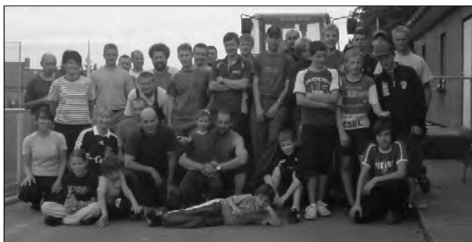
Die fleißigen Helfer und Akteure am Sportplatz.