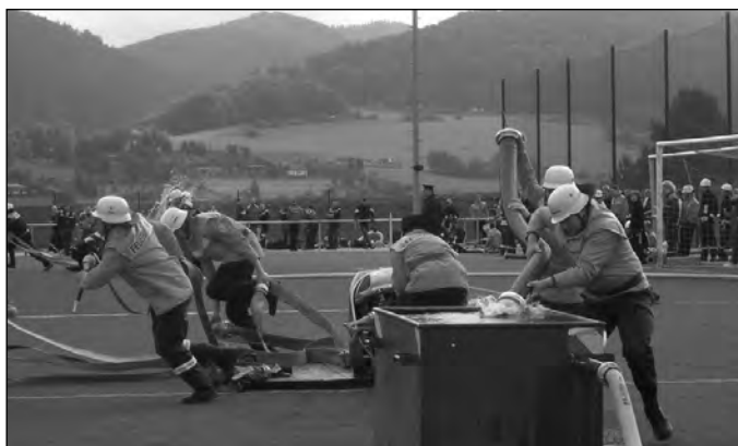
Eintauchen und los geht's!