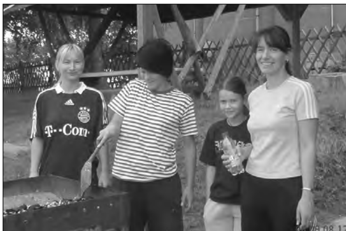
Wer arbeitet hat auch Hunger. Die Frauen übernehmen die Versorgung der fleißigen Helfer.