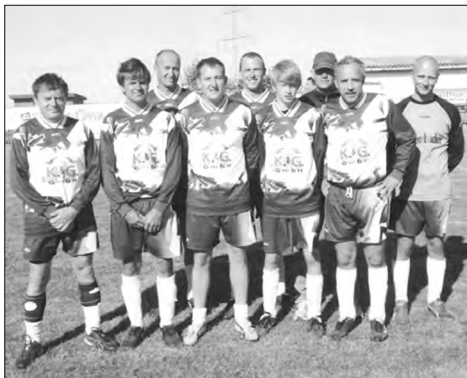
Die Mitglieder des Heimat- und Pfingstvereines Großhelmsdorf 1991 e. V.

Ein besonderer Dank gilt allen Sponsoren und Freunden unseres Vereines, ohne deren Unterstützung die Durchführung eines solchen Veranstaltungswochenendes nicht möglich ist.