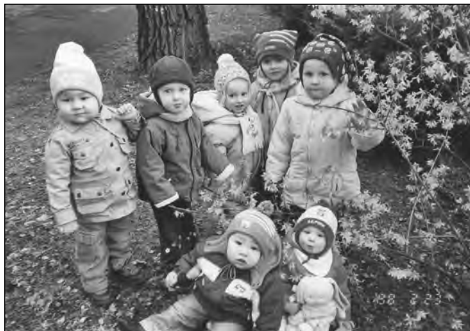
Die Kleinsten der Elstertalpatzen warten schon ganz gespannt auf den Osterhasen