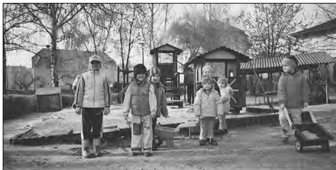
Viele Hände machen der Arbeit ein schnelles Ende ... Und der neue Spielsand ist rasch in die Sandkästen verteilt!