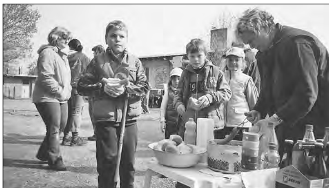
Nach getaner Arbeit gibt es eine Stärkung für alle!

Hier möchten wir uns nochmals bei allen Eltern bedanken, die unser Vorhaben gut unterstützen und uns reichlich mit Obst / Gemüse u. a. Leckereien versorgen.