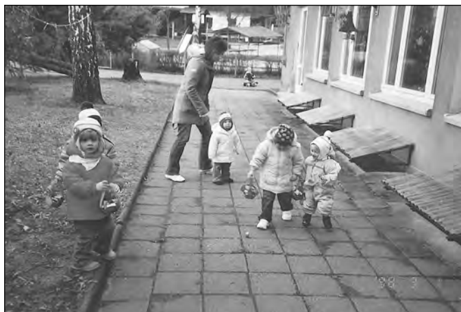
Hurra der Osterhase war da. Hinter Büschen und im Gras fand jedes Kind etwas.