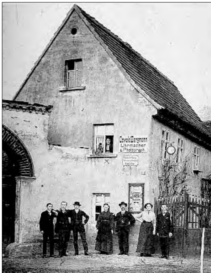
Geschäft des Uhrmachers und I. Hoffotografen Oswald Bergmann im Jahre 1890 auf dem Markt.

Computertechnik Matz stellt dafür kostenlos einen gebrauchten PC mit Zubehör und benötigtes Material.