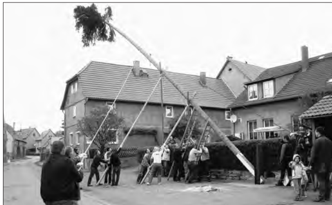
Die Maibaumsetzer 2010