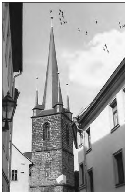
Kirche in Kahla mit Mauersegler- und Fledermausquartieren (Foto: R.H.)

Für das 2. Halbjahr wünsche ich allen Mitgliedern eine schöne Zeit.