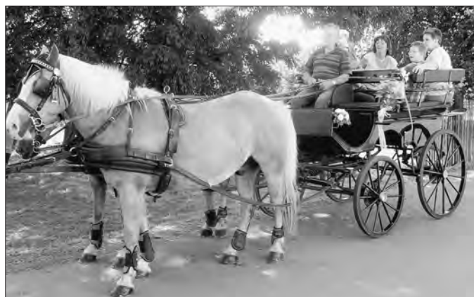
Die Rundfahrten mit der Pferdekutsche (zur Verfügung gestellt durch die Agrargenossenschaft Buchheim-Crossen eG) waren auch in diesem Jahr bei Einwohnern und Gästen beliebt.

Mit viel Spaß wurden verschiedene Wettbewerbe, wie Baumstamm-Weitwurf und Torwandschießen, durchgeführt. Dabei konnten schöne Preise gewonnen werden. Bei guter Unterhaltung, süßen Schlemmereien, herzhaften Leckerbissen und der nötigen Portion an kühlem Nass haben wir gemeinsam einen schönen Nachmittag verbracht. Am Abend sorgte DJ Arndt nicht nur für Tanzmusik; die Musikbegeisterten bekamen zu später Stunde die Gelegenheit für Karaoke - welch ein Gaudi!